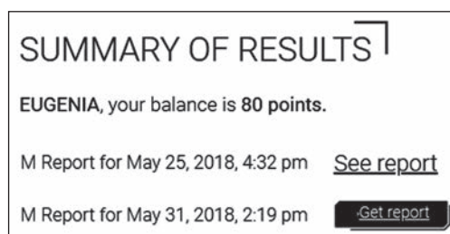
Рис. 2. Личный кабинет

При этом будет создан личный кабинет (рис. 2) на сайте vibrabrain.com, в котором можно следить за состоянием счёта, расходами баланса, а также просматривать результаты измерений как уже оплаченные, так и те, которые были получены, но не оплачены и пока скрыты от пользователя.